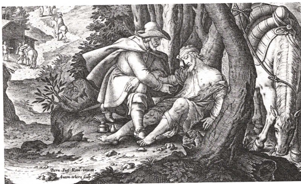
Il buon samaritano.

Sped. in Abb. Postale 70% Filiale Brescia